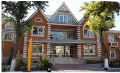
FERGANA-AZIA FERGANA 3*